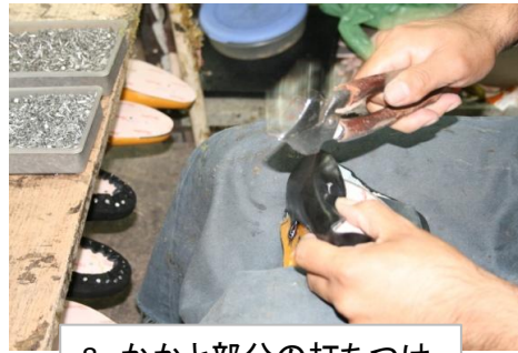
8 かかと部分の打ちつけ