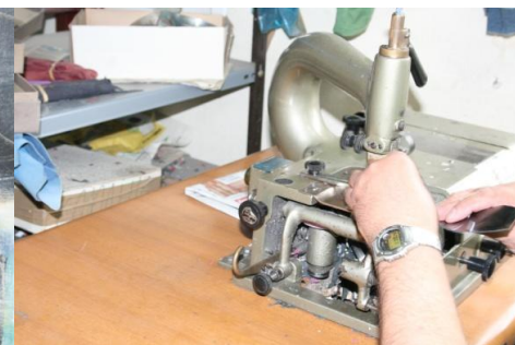
5 靴底のソール板の裁