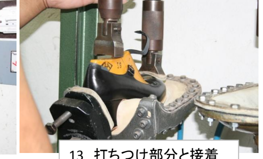
13 打ちつけ部分と接着部分の固定のための圧縮