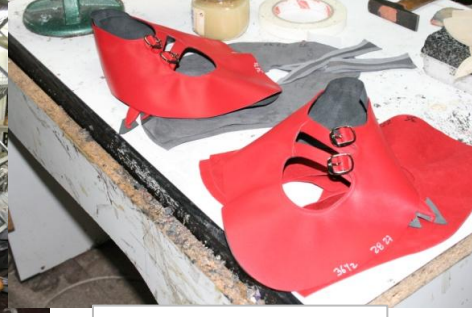
3 木型に沿って革を