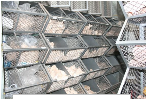
かかとヒールの在庫 これは別のヒール専門の