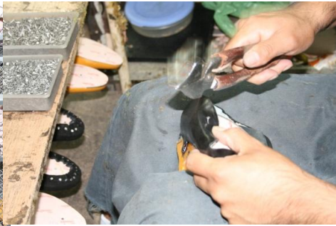
6 ソール板を革のパター