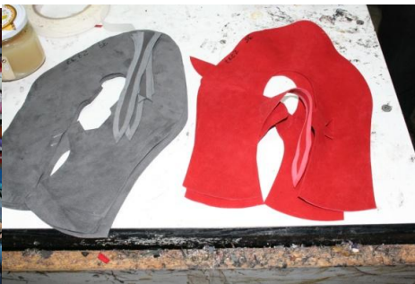
2 パターンに沿って裁