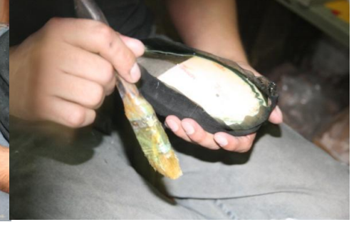
7 合わせ部分の接着 一乾燥