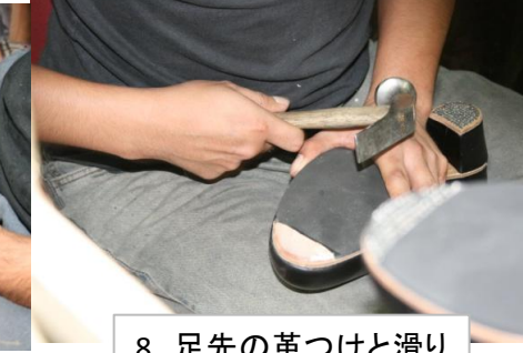
8 足先の革つけと滑り