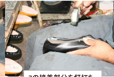
7の接着部分を釘打ち