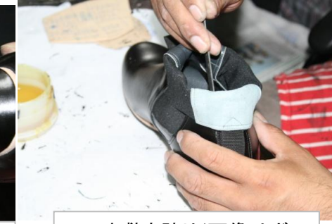
11 中敷き貼り(画像はボ)